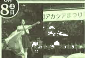
秋田県警音楽隊コンサート