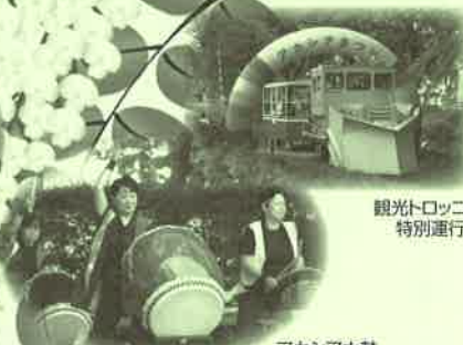
観光トロッコ 特別運行